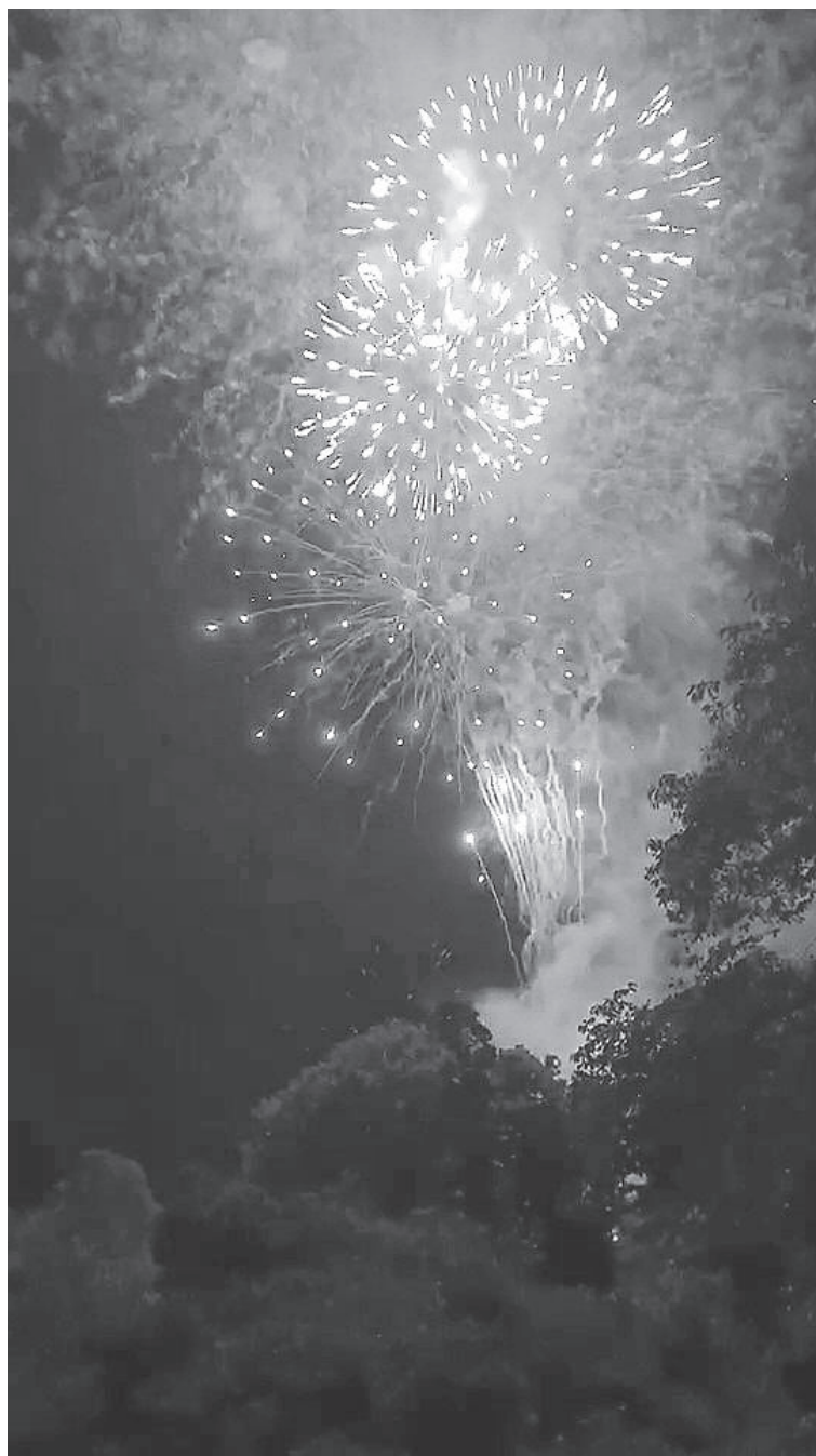
〈撮影は花巻小学校付近にて・花巻市在住者より〉

新型コロナウイルスの感染拡大をうけて、1日も早い収束を願い、花火師の方々による希望や元気を届けようとする取り組みが全国的に広がっております。花火のルーツをたどると悪疫退散祈願を目的とし打ち上げることが花火大会の起源とも言われ、これまで鎮魂目的や復興を願う花火も打ち上げられてきました。6月は盛岡市で7月は花巻市と一関市で打ち上げられた花火を見て、感動とともにコロナの早期終末を切に願います。